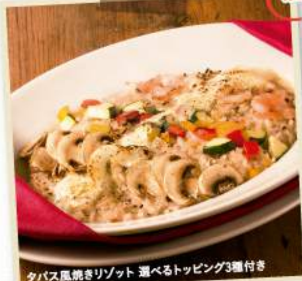
タバス風焼きリゾット 選べるトッピング3種付き

パルミジャーノレッジャーノで仕上げたリゾットをオープンで焼き上げたタバスオリジナルリゾットです