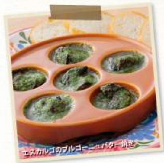
エスカルゴのブルゴーニュバター焼き