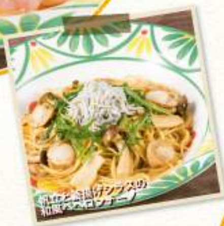
真ダコと釜揚げシラスの和風ペペロンチーノ