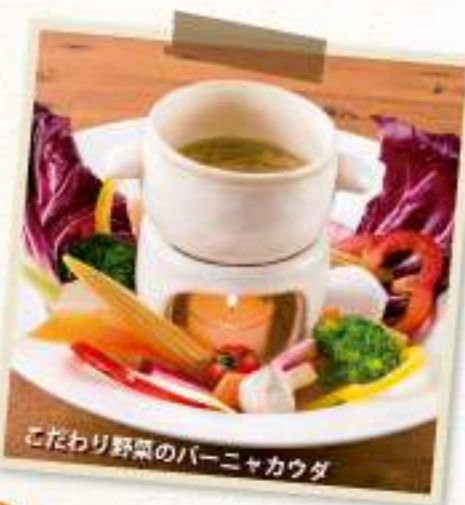
こだわり野菜のバーニャカウダ