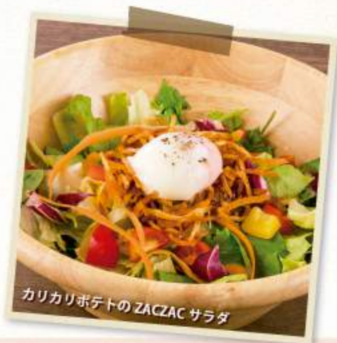
カリカリポテトの ZACZAC サラダ