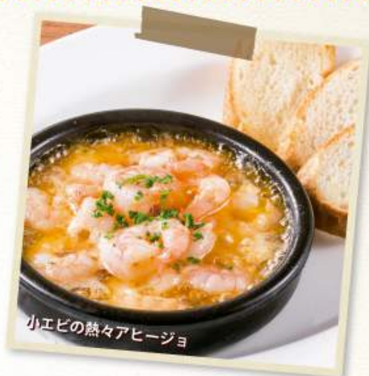
小エビの熱々アヒージョ