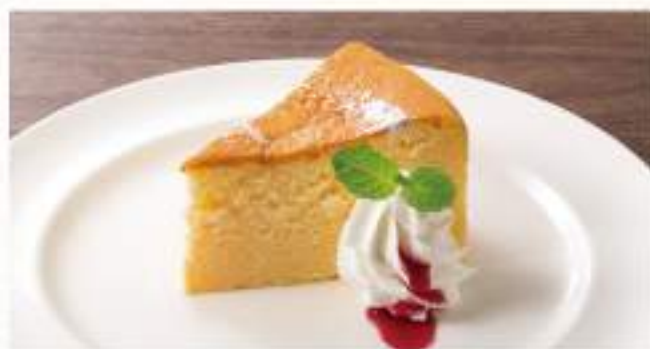
◇ チーズスフレ ¥400 チーズケーキの定番