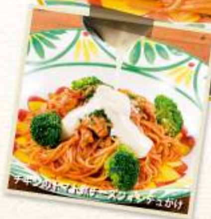
チキンのトマト煮にチーズフォンデュがけ