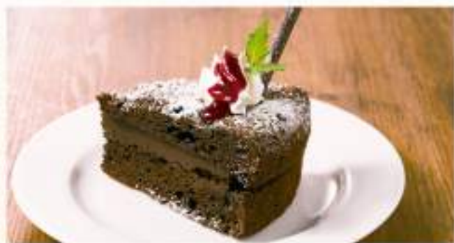
◇ クラシックダブルショコラ ¥400 ガトーショコラに濃厚なビターガナッシュをサンド