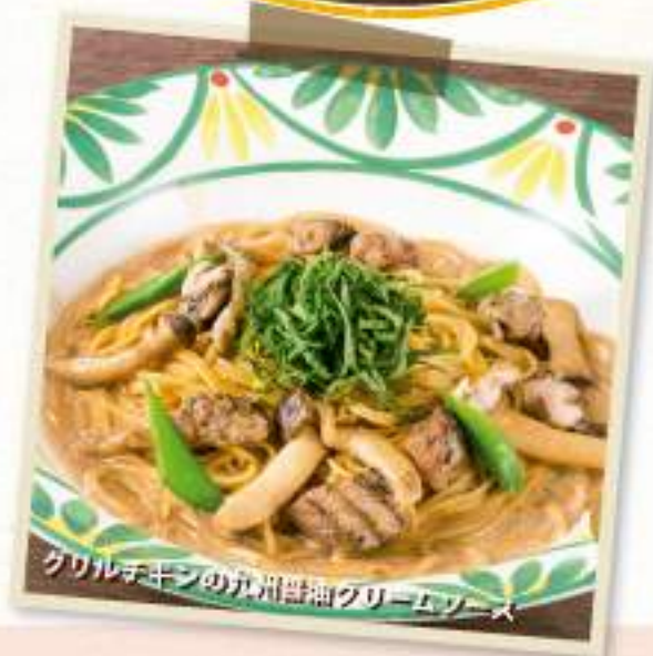
グリルチキンの九州醤油クリームソース