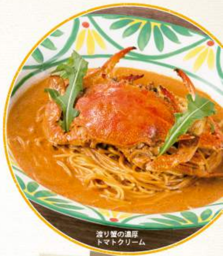
渡り蟹の濃厚 トマトクリーム