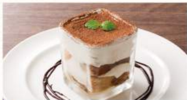
◇ 自家製ティラミス ¥400 北海道産マスカルポーネ使用のクリーミーなティラミスです