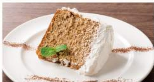
◇ はちみつ紅茶のシフォン ¥400 タバスオリジナル「はちみつ紅茶」を使用