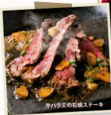
牛ハラミの石焼ステーキ