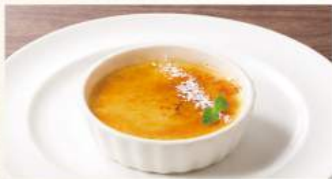
◇ クレームブリュレ ¥400 カリカリのキャラメルが主役