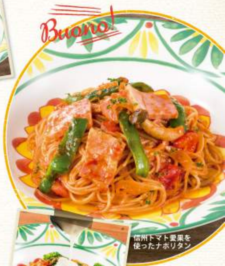
信州トマト愛果を使ったナポリタン