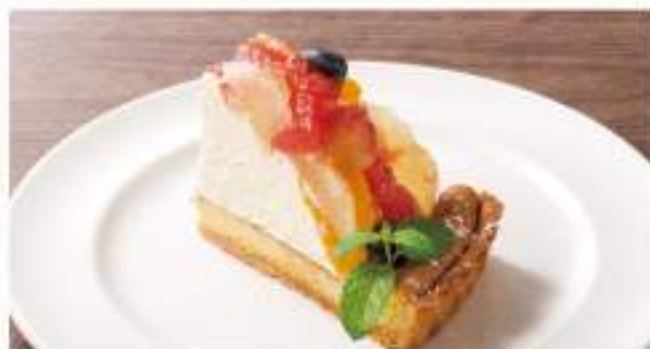
◇ 季節のフルーツタルト ¥400 旬のフルーツとたっぷりカスタード