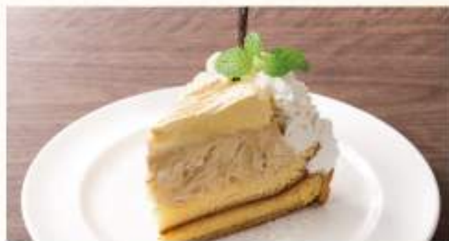
◇ キャラメルバナナタルト ¥400 一番人気 バナナとたっぷりキャラメルクリーム