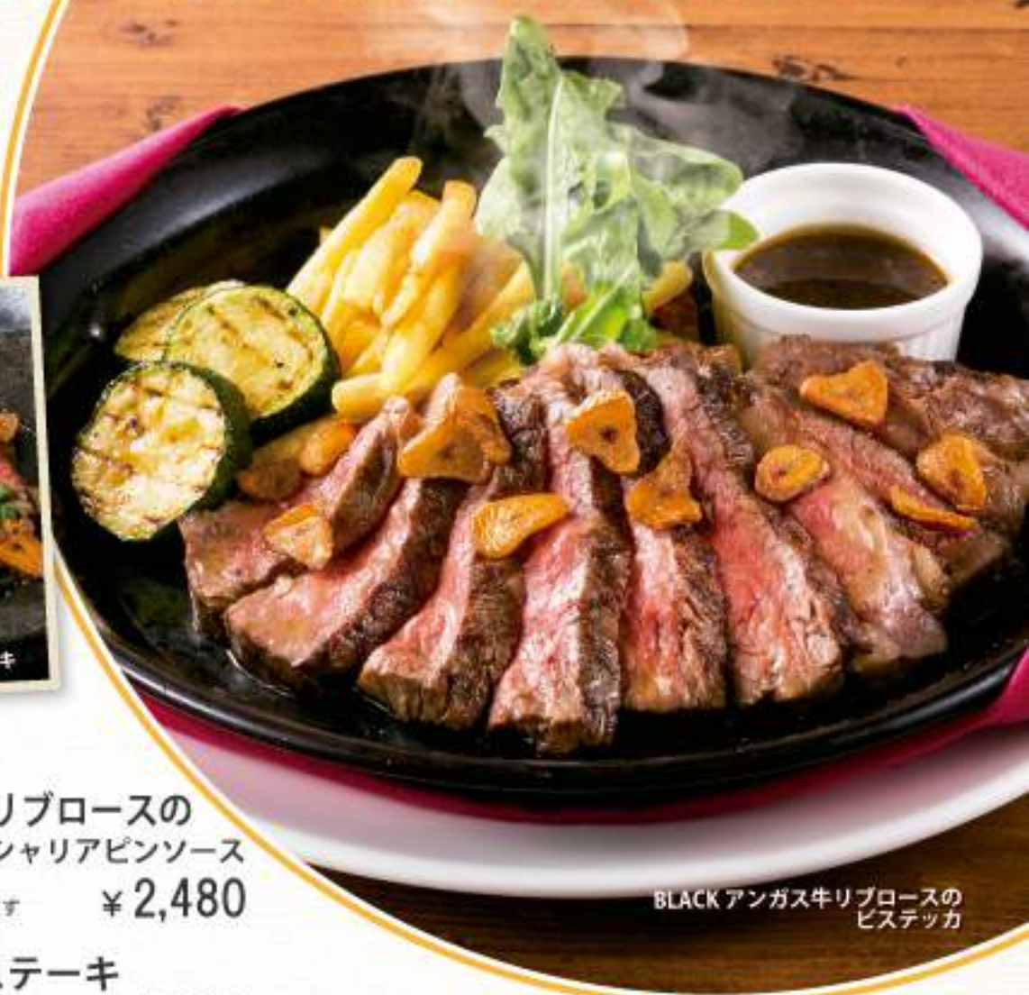
BLACK アンガス牛リブロースの ビステッカ