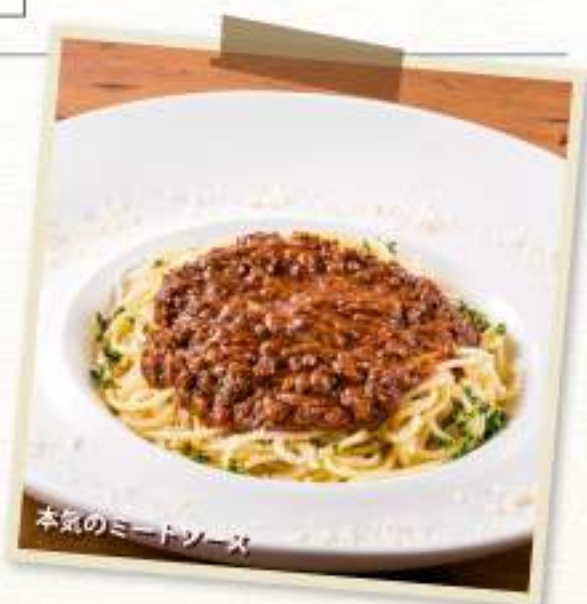
本気のミートソース