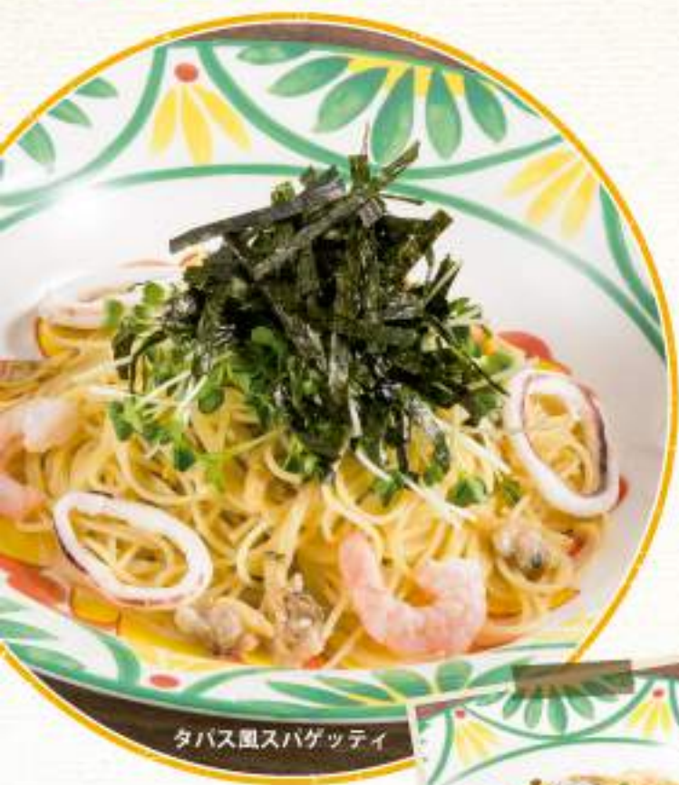
タパス風スパゲッティ